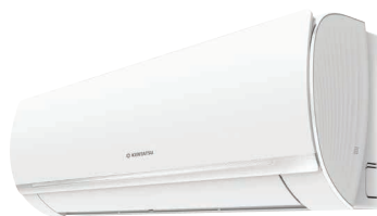
Внутренний блок KSGOT26HZRN1