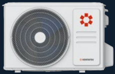
Наружный блок KSRKU50HZRN1