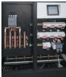
Внутренний вид котла Nobby Electro KBL