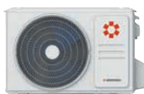
Наружный блок KSRP26HZAN1