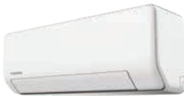
Внутренний блок KSGP26HZRN1