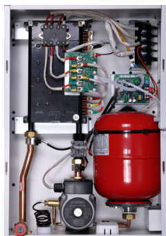
Внутренний вид котла Nobby Electro KBO